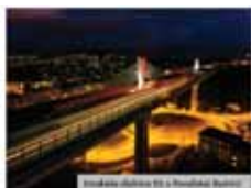
Vlnovka v Prievidzi