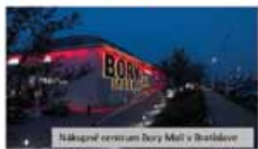
Nákupné centrum Dory Mall v Bratislave