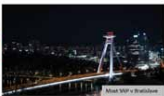
Most SNP v Bratislave