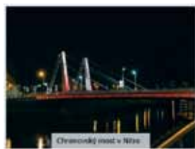
Osvobodní most v Nitre