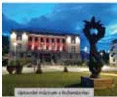
Jarkov v Prievidzi