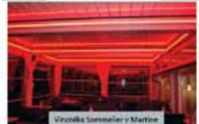
Vlnovka v Martinci