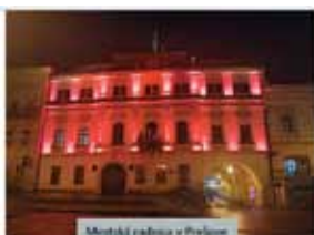
Mestská radnica v Prievidzi