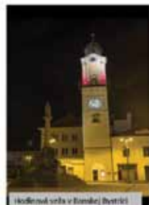
Ľadičská veža v Banskej Bystrici