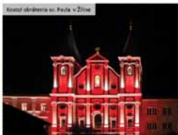
Kostol obrátenia sv. Pavla v Žiline