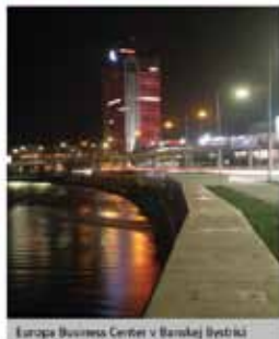
Europe Business Center v Banskej Bystrici