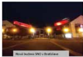
Nová budova SNP v Bratislave