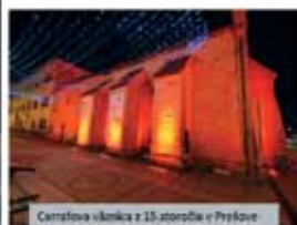
Čerapova vilka v Prievidzi