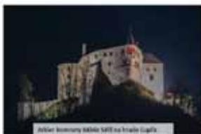
Jarkov v Prievidzi