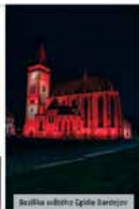
Bazilika svätého Ľudola v Bardejove