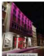
Mestská radnica v Prievidzi