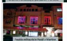
Faloša mládežníckej Partá v Martinci