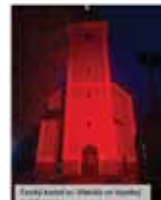
Vlnovka v Prievidzi