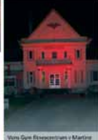
Vlna v Martinci