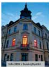
Mestská radnica v Prievidzi