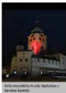
Veža mestského hradu Bartolka v Banskej Bystrici