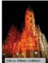
Jarkov v Prievidzi