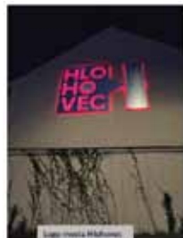
Mestská radnica v Prievidzi