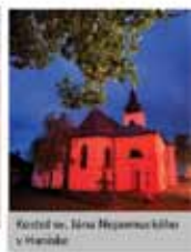
Kostol sv. Jána Nepomuka káňer v Hrabovke