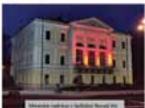
Mestská radnica v Prievidzi