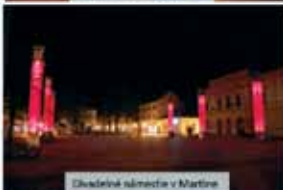
Občianske námestie v Martinci