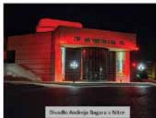
Divadlo Andreja Bagari v Nitre

Okrem rozsvetovania monumentov na červeno bola vydaná tlačová správa, ktorá bola uverejnená na viacerých spravodajských portáloch. Okrem toho naši členovia šírili informácie aj vo viacerých celoslovenských a regionálnych médiách (RTVS, TV Markíza, TV JOJ, RTVS Rádio Regina, TV Turiec). Zároveň by som chcel zo srdca poďakovať všetkým, ktorí nám pomohlo pri zabezpečovaní osvetľovania objektov.