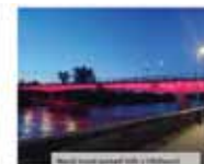
Vlnovka v Prievidzi