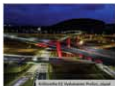
Vlnovka v Prievidzi