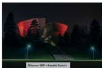
Mestská radnica v Prievidzi