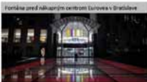
Fontána pred nákupným centrom Lushova v Bratislave