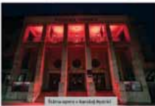
Jarkov v Prievidzi