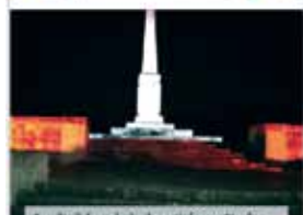
Pamätník francúzskych partizánov v Štrbe