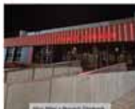
Mestská radnica v Prievidzi