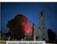
Vlnovka v Prievidzi