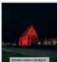
Mestská radnica v Bardejove