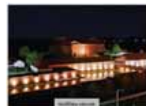
Vlnovka v Prievidzi