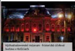
Výševní obnovené múzeum - historická účelová budova v Košiciach