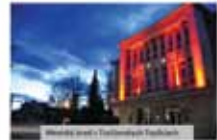
Mestská radnica v Prievidzi