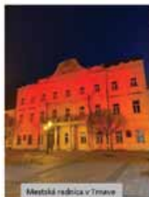
Mestská radnica v Trnave