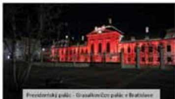
Prezidentský palác - Gracafaktor/Čer palác v Bratislave