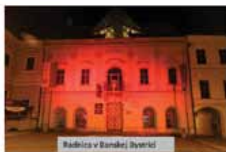
Radnica v Banskej Bystrici