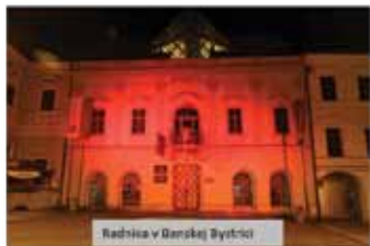
Radnica v Banskej Bystrici