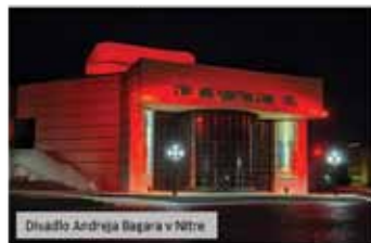
Divadlo Andreja Bagara v Nitre

Symbolom 17. apríla po celom svete a výzvou na zapojenie pre verejnosť je aj rozsvetovanie červených svetiel v domácnostiach a tiež vysvetcovanie významných budov a monumentov načerveno.