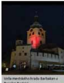
Veľa mestského bráda Barbakan v Banskej Bystrici