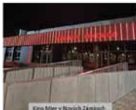
Klop Mier v Ruzujových Zámokoch