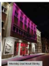
Mestský úrad Nová Zámka