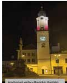
Hodrová veža v Banskej Bystrici