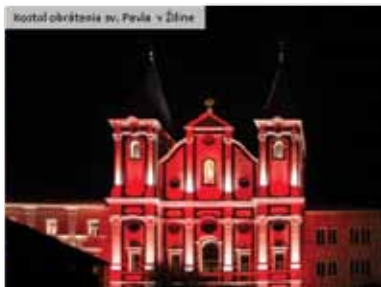
Kostol obrátenia sv. Pavla v Žiline