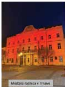
Mestská radnica v Trnave