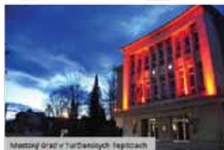
Mestský úrad v Turčianskych Tepliciach