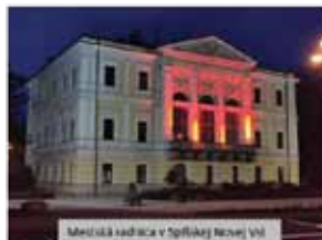
Mestská radnica v Spišskej Novej Vsi