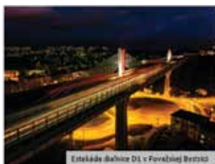
Estakáda Baľva D1 v Fovčianskej Bystrici