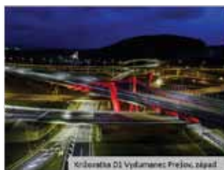
Križovatka D1 Vyšňavce Prešov, západ

Na nasledujúcich stranách ponúkame našim členom fotografie všetkých vysvietených objektov v tento deň na Slovensku. Kompletný album fotografií môžete nájsť na našej stránke na sociálnej sieti Facebook „Slovenské hemofilické združenie“