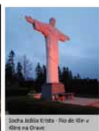
Socha Ježiša Kráľa - Páň do klňa v Kľno na Orave