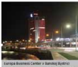
Europa Business Center v Banskej Bystrici