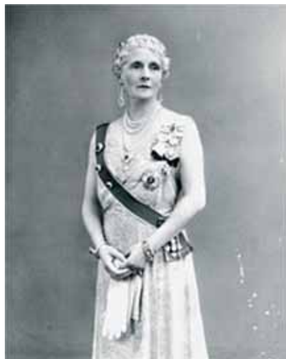
Princezná Alica z Albany Alicin