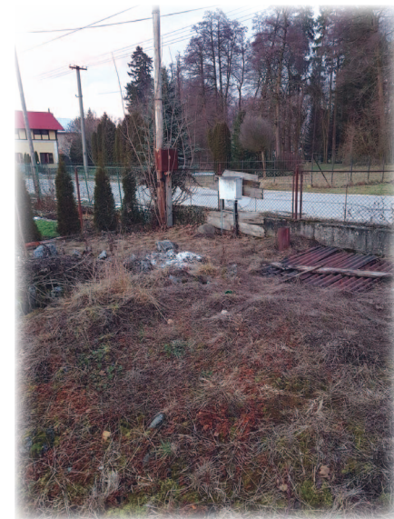
Fotodokumentácia k aktuálnej situácii na nedokončenej stavbe domu SHZ.