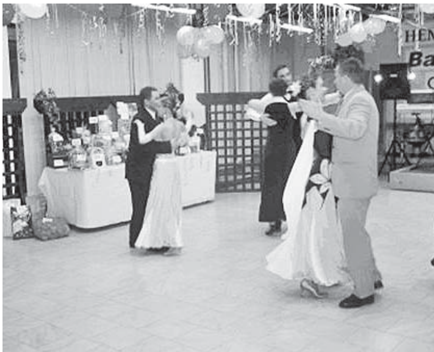
Otváracie tance plesu

Všetci naši účinkujúci si plne zaslúžili náš potlesk.