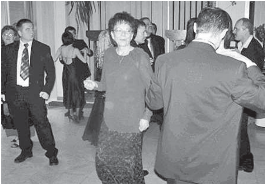
Zabávajúci sa účastníci plesu