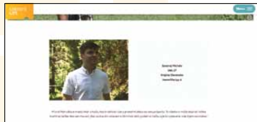
Motivačné video o našom členovi na webovej stránke www.liberatelife.sk